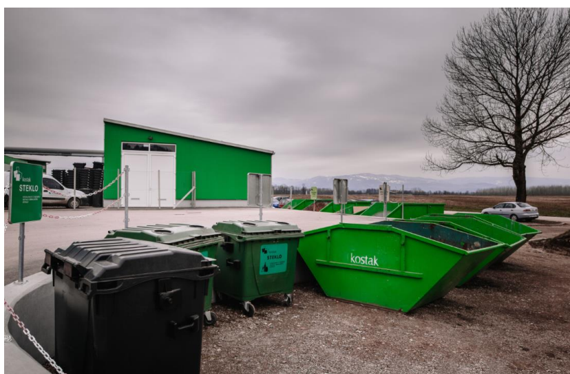
Slika 3: Zunanji ekološki otok na Centru za ravnanje z odpadki Spodnji Stari Grad

V poletnem času je možnost oddaje odpadkov od 7.00 do 19.00 oziroma pozimi do 18.00 in v soboto od 7.00 do 15.00.