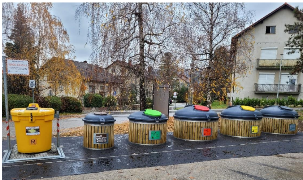
Slika 2: Podzemna zbiralnica za ločeno zbiranje odpadkov