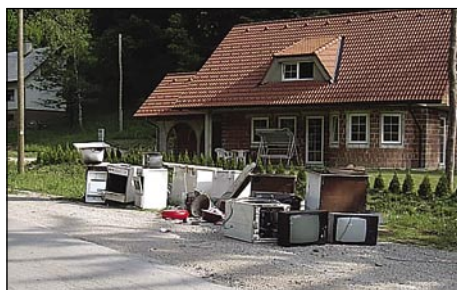
Zbiranje kosovnih odpadkov

V mesecu aprilu 2005 bomo posebno skrb namenili kosovnim odpadkom iz gospodinjstev. Takšna pomladanska akcija zbiranja kosovnih odpadkov je dobrodošla zato, da se tako preprosto znebite odvečnih predmetov, ki bi sicer najbrž končali na divjih odlagališčih. Pobirali bomo SAMO KOSOVNE ODPADKE IZ GOSPODINJSTEV, to so: pohištvo, bela tehnika, sanitarni elementi in drugi kosovni