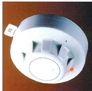
Ionizacijski javljalnik požarov

Še nedavno so bili zelo priljubljeni strelovodi, opremljeni z izvorom radioaktivnega sevanja, saj je veljalo prepričanje, da so učinkovitejši od navadnih kovinskih