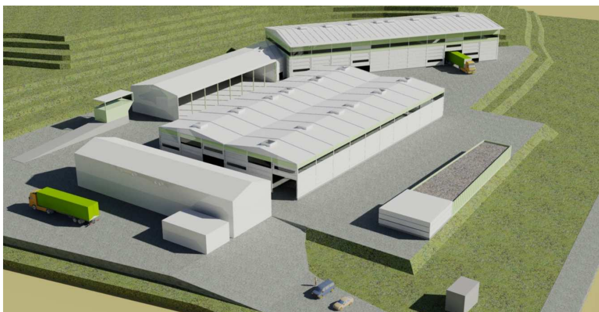
Slika 1: Center za ravnanje z odpadki Spodnji Stari Grad

Center za ravnanje z odpadki Spodnji Stari Grad (v nadaljevanju CRO SSG) je namenjen obdelavi in skladiščenju vseh vrst komunalnih odpadkov, zbranih v okviru opravljanja občinske gospodarske javne službe zbiranja komunalnih odpadkov, ter obdelavi zbranih oziroma prevzetih komunalnih odpadkov, vključno z nekaterimi drugimi vrstami odpadkov.