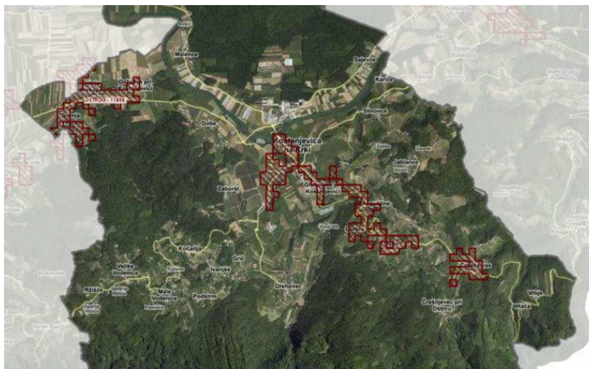
Slika 2: Prikaz AGLO v občini Kostanjevica na Krki

V mesecu aprilu 2017 smo sodelovali pri pripravi novelacije aglomeracij. Podali smo pripombe glede na nov osnutek aglomeracij, predvsem v smislu zmanjšanja velikosti območja aglomeracije glede na gostoto poselitve. Predlog spremembe oziroma novelacija še ni bila sprejeta oziroma potrjena.