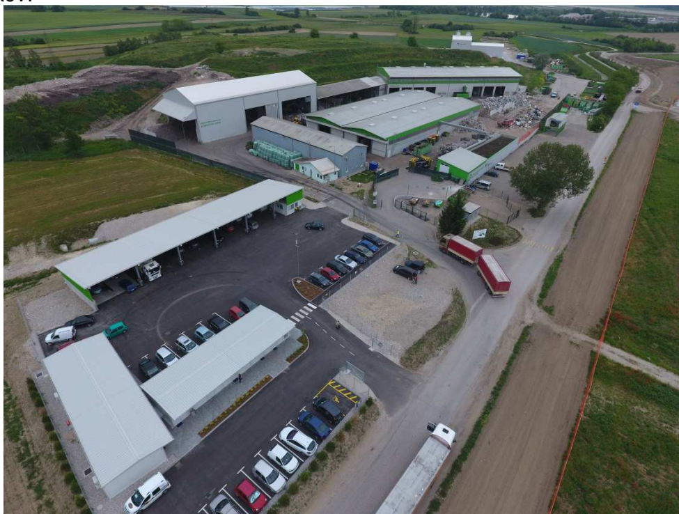
Slika 1: Center za ravnanje z odpadki Spodnji Stari Grad

Center za ravnanje z odpadki Spodnji Stari Grad (v nadaljevanju CRO SSG) je namenjen obdelavi in skladiščenju vseh vrst komunalnih odpadkov, zbranih v okviru opravljanja občinske gospodarske javne službe zbiranja komunalnih odpadkov, ter obdelavi zbranih oziroma prevzetih komunalnih odpadkov, vključno z nekaterimi drugimi vrstami odpadkov.