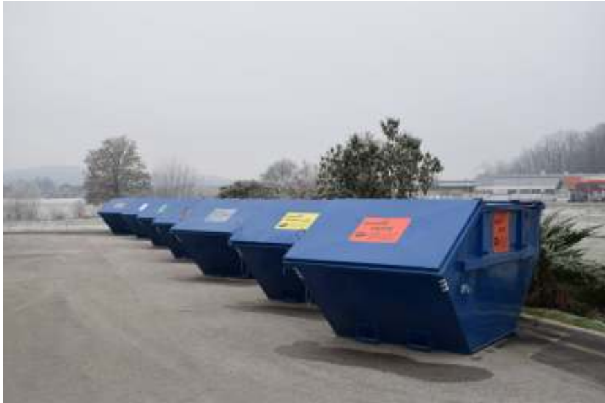
Slika 2: Novi zbirni center za odpadke v Kostanjevici na Krki

Za opravljanje osnovne storitve zbiranja in odvoza komunalnih odpadkov se uporabljajo standardizirane posode za odpadke in specialna smetarska vozila, s katerimi se zbirajo in odvažajo tako mešani komunalni odpadki kot tudi ločeno zbrane frakcije, vendar vsaka frakcija posebej. Vsi odpadki se dostavijo na CRO SSG, kjer se ustrezno začasno skladiščijo, obdelajo in oddajo registriranim prevzemnikom. Mešana embalaža in mešani komunalni odpadki se sortirajo na mehanski sortirni liniji. Del odpadkov, ki ni primeren za odlaganje in ima še uporabno vrednost, se preda v recikliranje, del pa v predelavo v alternativno gorivo. Del, ki je primeren za odlaganje, se odloži na odlagališču, ki je s strani občine pooblaščen za odlaganje odpadkov. Kosovni odpadki se temeljito pregledajo ter oceni stopnja kakovosti in nadaljnja možnost uporabe. Najkakovostnejši deli se namenijo pripravi na ponovno uporabo, slabši pa recikliranju oz. proizvodnji alternativnega goriva. Izrabljena jedilna olja, nevarni odpadki, steklena embalaža in odpadne nagrobne sveče se na CRO SSG ne obdelujejo, temveč se predajo registriranim prevzemnikom.