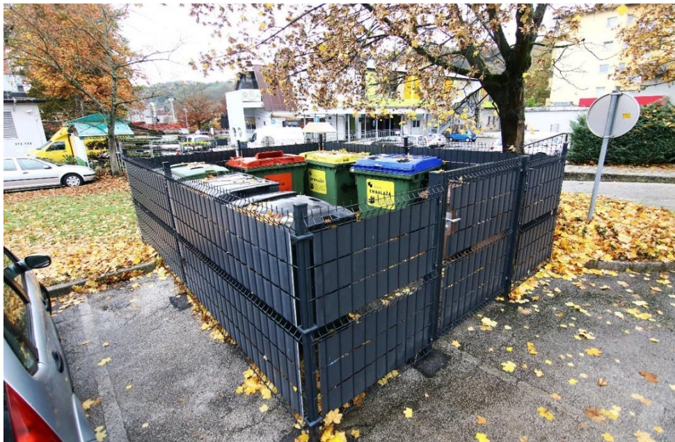
Slika 1: Nadzemna zbiralnica za ločeno zbiranje odpadkov

Poleg odpadkov, ki so opredeljeni z zakonodajo, na nekaterih ekoloških otokih zbiramo tudi odpadno jedilno olje in odpadno električno in elektronsko opremo.