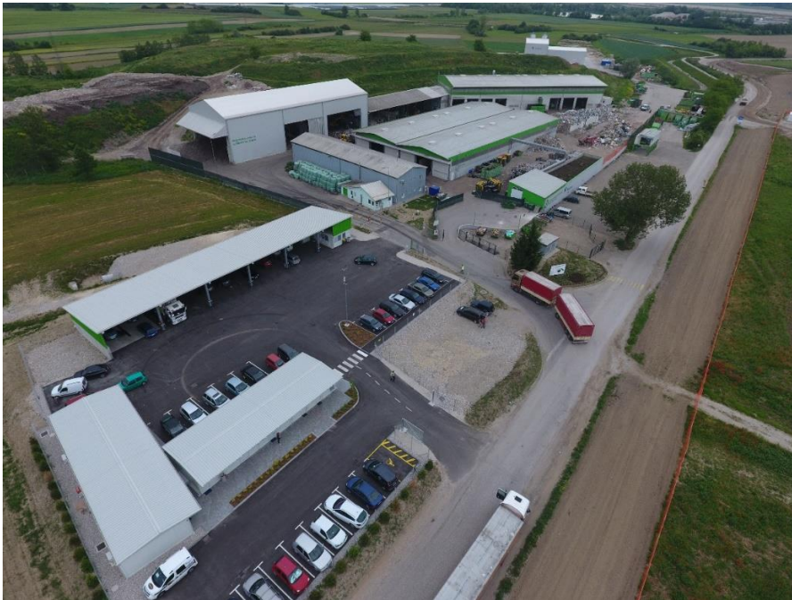
Slika 3: Center za ravnanje z odpadki Spodnji Stari Grad