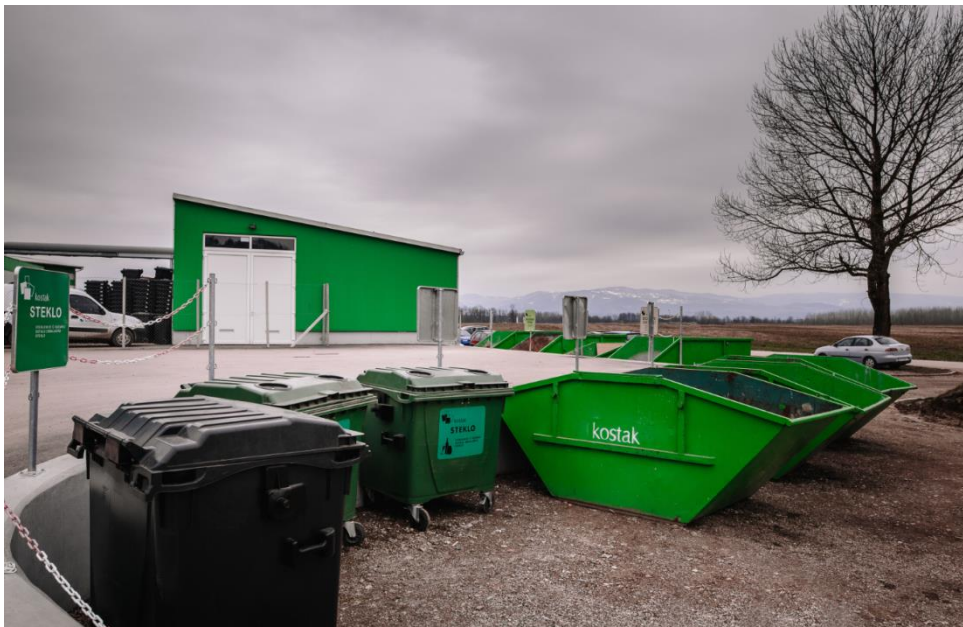
Slika 4: Zunanji ekološki otok na Centru za ravnanje z odpadki Spodnji Stari Grad