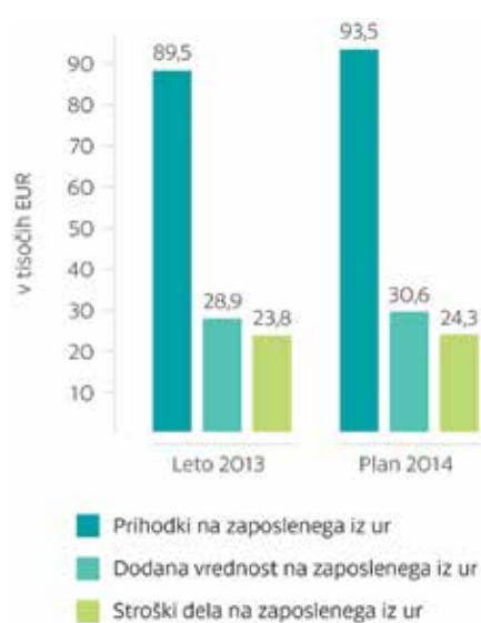
GRAF: PRIHODKI, DODANA VREDNOST IN STROŠKI DELA NA ZAPOSLENEGA

Naši kazalniki uspešnosti v letu 2013 so rezultat vlaganj v raziskave in razvoj in v nove proizvodne zmogljivosti in izboljšanje tehnologije ter dobrega gospodarjenja. So tudi rezultat naložb v zaposlene, ohranjanje okolja, pa tudi v zmanjševanje stroškov.