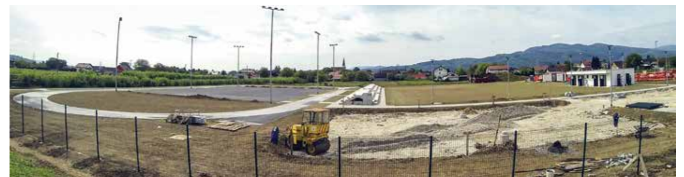
UREDITEV ŠPORTNIH POVRŠIN PRI OŠ DOBOVA

Pri izvedbi gradbenih del smo se trudili, da bi dela izvedli kakovostno in da bi pri tem v največji meri upoštevali želje investitorja in prebivalcev, ki bodo neposredni uporabniki novih ureditev. Nadvse smo si prizadevali, da bi dela končali v predvidenih rokih in da bi delo potekalo v skladu z vsemi zahtevami odgovornega in zanesljivega izvajalca gradbenih del.