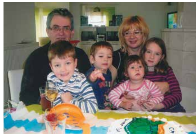
VESELJE Z OTROČKI

V zadovoljstvo mi je, da smo se v Kostaku vseskozi trudili za lasten razvoj in lastne uspehe. Verjeli smo,