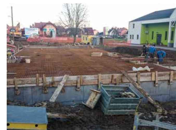
PRIPRAVA ARMATURE PRED BETONIRANJEM KROVNE PLOŠČE NA ZADRŽEVALNEM BAZENU PADAVINSKIH VODA (ZBDV) V HOČAH, KI JE LOCIRAN PRED OBČINSKO STAVBO

Dela na kanalizacijskem sistemu Hoče-Slivnica obsegajo okvirno 20 km kanalizacije in potekajo v skladu s predvidenim terminskim planom. Projekt je razdeljen na kanalizacijski sistem v Hočah in na del v Hotinji vasi. V lanskem letu je bila glavnina del usmerjena na izgradnjo dela v