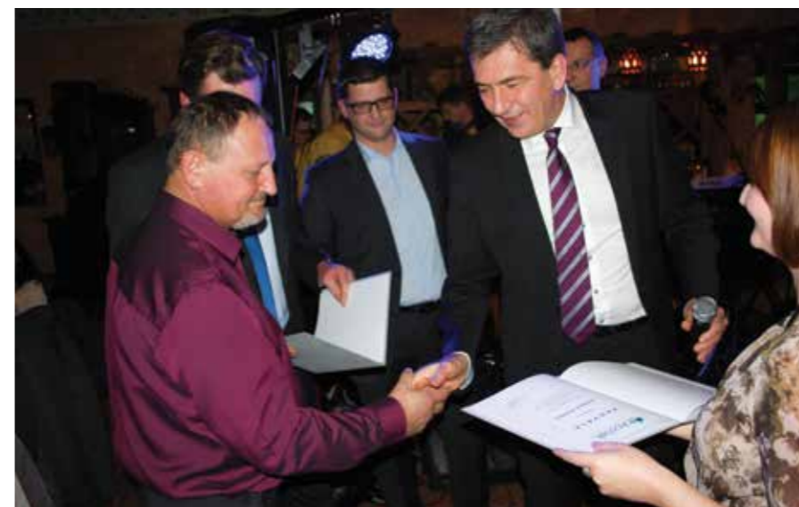
PREDSEDNIK PODELI ZAHVALO