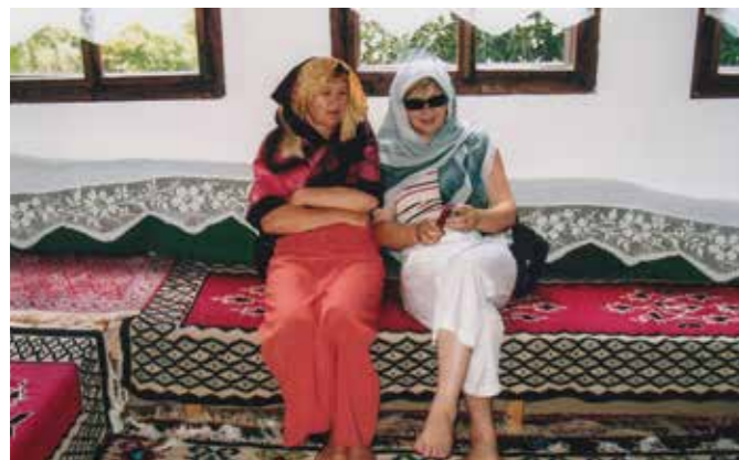
S SESTRO NA OBISKU IZVIRA REKE BUNE