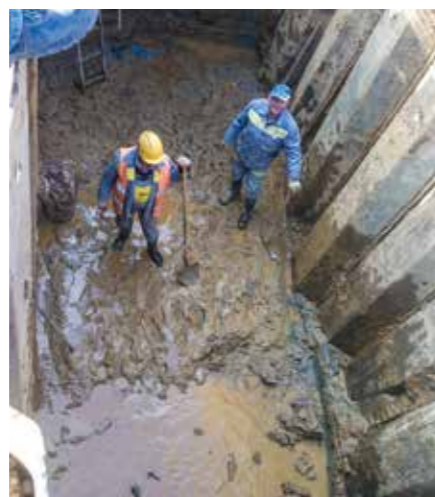
PRIPRAVA GRADBENE JAME – VAROVANJE Z ZAGATNICAMI ZA IZVEDBO PODVRTAVANJA POD AVTOCESTO V HOTINJI VASI

Hočah–kolektor Rečnik–Glaserjev trg in zadrževalnega bazena padavinskih voda (ZBDV), letos pa se gradnja širi na delu v Hotinji vasi. Trenutno je izvedeno 60% vseh cevovodov, za dokončanje ostaja še 8km kanalizacije in izvedba asfaltnih prevlek nad zgrajenimi kanali. Zaključek del je predviden v jesenskih mesecih tega leta.