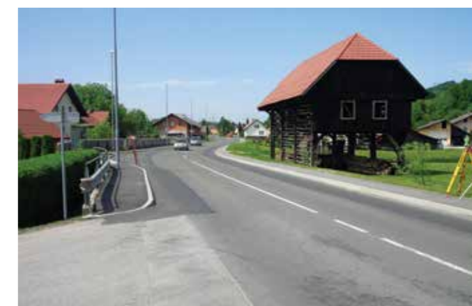
POGLED NA ZAKLJUČENA DELA V DOLENJI VASI PRI UVOZU K VRTCU – NA OBEH STRANEH CESTE SO OBNOVLJENI PLOČNIKI IN AVTOBUSNA POSTAJA.