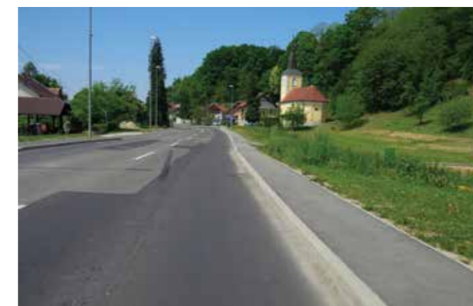
ZAKLJUČENA DELA V STAREM GRADU.