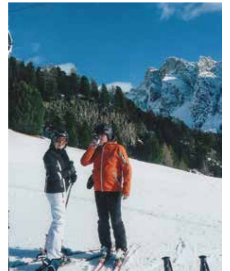
MED GORAMI NA POHORJU

Podjetje Kostak je rastlo in se razvijalo. Z vključitvijo Togrela se je krepila in širila gradbena dejavnost, saj so se obetali večji posli pri gradnji