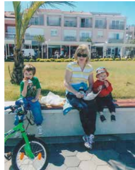
V MEDULINU Z VNUČKOMA

V teh nekaj dneh po upokojitvi sem zaživela s polnimi pljuči. Spoznanje, da ni ničesar niti nikogar, ki bi mi krojil dneve po svoji meri, mi je dalo občutek svobode in ogromno energije. Vsak dan je aktiven. Res je, da včasih ne vem, kateri dan v tednu je, vendar pa vsako jutro vem, kaj bom delala tistega dne. Ko omenjam delo, to tudi resno mislim. Delo, seveda pa tudi veselje, je na primer urejanje doma, za katerega v času aktivnega dela nikoli ni bilo dovolj časa, pa vrtarjenje, ukvarjanje z vnuki.... Končno