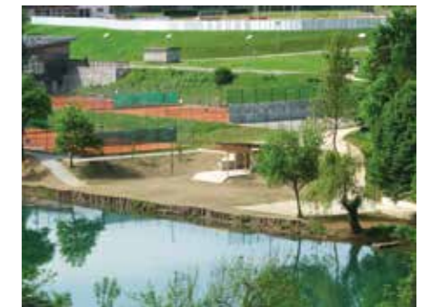
PORTOVAL NOVO MESTO