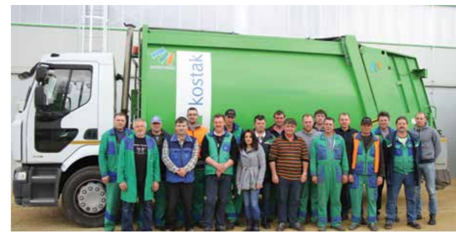
SO DELAVCI NA CRO