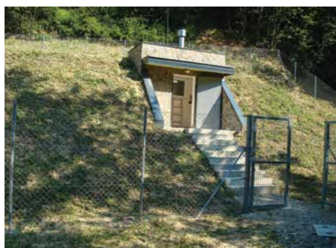
DOKONČAN VODOHRAN DOBROVA