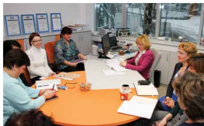
Z DEKLETI IZ SEKTORJA