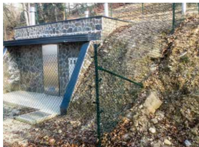
DOKONČAN VODOHRAN RAVNI