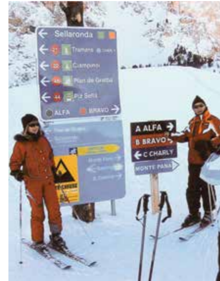
SMUČANJE V DOLOMITIH

Poklicno pot v Kostaku sem začela leta 1980 kot knjigovodja osebnih