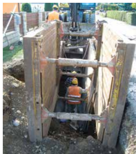
RAZPIRANJE KANALOV PRI GRADNJI KANALIZACIJE V HOTINJI VASI