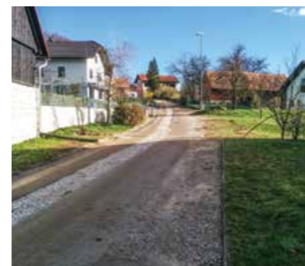
ZAKLJUČENA GRADNJA KANALA DV 4 NA LIBNO.

V mesecu maju se zaključuje izgradnja Kanalizacije v Dolenji vasi in Starem Gradu. Dobri dve leti trajajoč projekt zajema cca 5 km kanalov iz poliesterskih cevi, ki potekajo skozi Stari Grad in Dolenjo vas. Primarni vod poteka ob državni cesti Krško Brežice, na njega pa se priključujejo stranski kanali z leve in desne strani. Vgrajeno je tudi črpališče v Starem gradu, ki služi za prečrpavanje odpadne vode na čistilno napravo Krško.