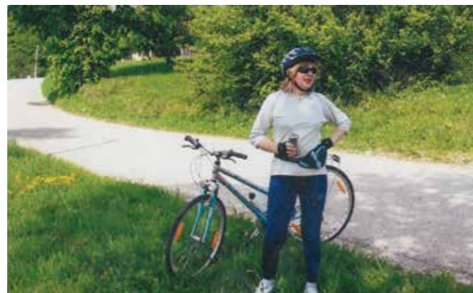
MENI LJUBO KOLESARJENJE