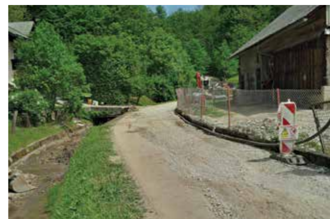
ZAKLJUČNA FAZA KANALA DV 4 V SMERI PROTI LIBNI – PRED PRIPRAVO ZA IZVEDBO ASFALTA.