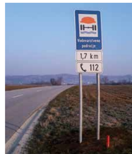
OBVESTILNI ZNAK, KI OZNAČUJE VODOVARSTVENO OBMOČJE.

Območje vodnega telesa podzemne vode Krškega polja spada med najbolj rodovitna kmetijska tla v Posavju, zato je zelo izpostavljeno onesnaženju zaradi neustrezne uporabe gnojil in fitofarmaceutskih sredstev. Ker skoraj polovico pitne vode črpamo iz vodnjaka Brege, je za nemoteno oskrbo s kakovostno pitno vodo vseh uporabnikov vodovoda Krško nujna aktivna zaščita vodnih virov v smislu ozaveščanja kmetov o pravilni uporabi fitofarmaceutskih sredstev ter ustrezno izvajanje gnojenja kmetijskih površin na širšem vodovarstvenem območju vodnega vira, ozaveščanja širše javnosti o pomenu varovanja vodnih virov, pozivu državnih institucij k takojšnjemu sprejetju nove Uredbe o varovanju vodnih virov na območju