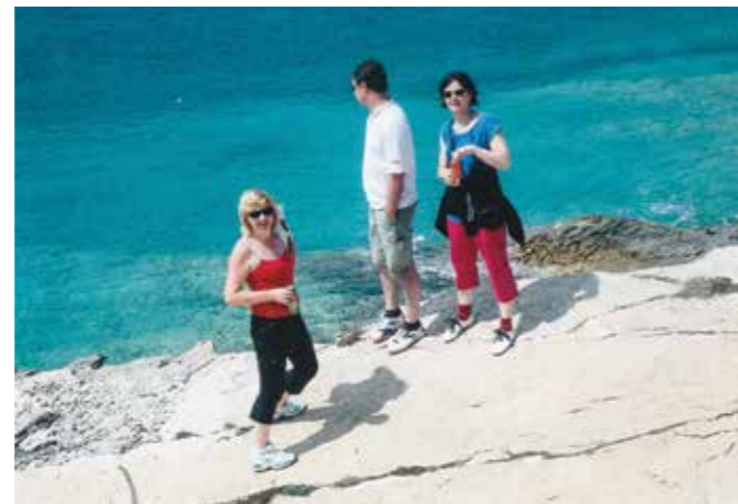
V KAMENJAKU OB STOPINJAH DINOZAVROV