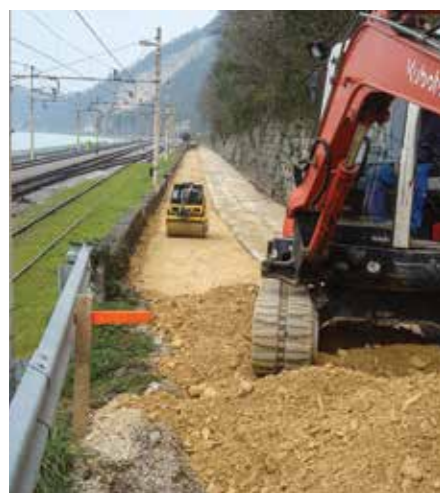
UTRJEVANJE ZASIPA NAD VGRAJENIM VODOVODOM NA ODSEKU SOTELSKO