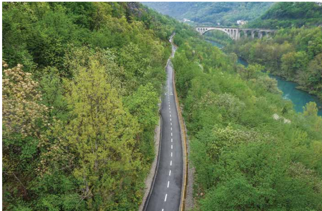
KOLESARSKA STEZA SOLKAN