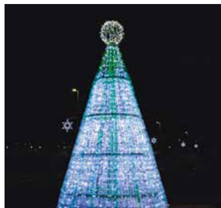
JELKA IZ PLASTENK V ZATONU, DECEMBER 2014