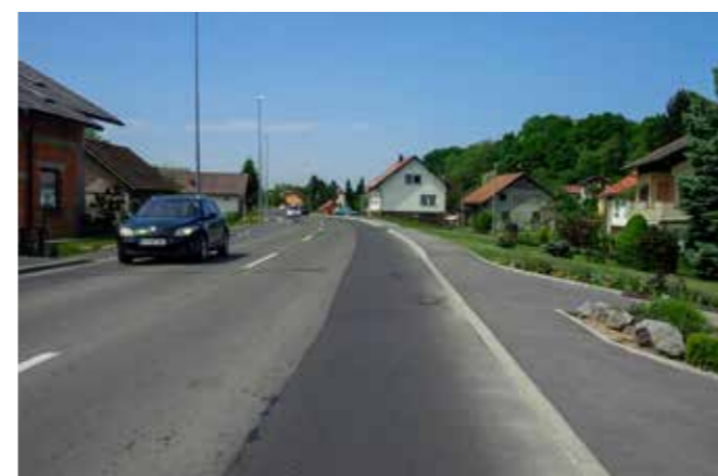
ZAKLJUČENI PLOČNIKI IN UVOZI K STANOVANJSKIM OBJEKTOM V DOLENJI VASI.