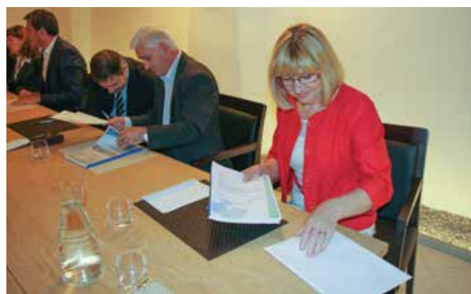
NA ZADNJI SKUPŠČINI DRUŽBE