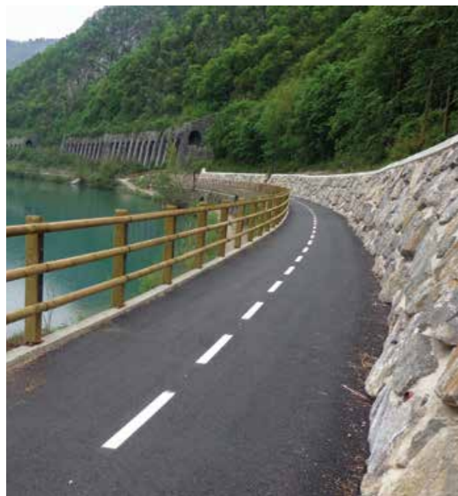
KOLESARSKA STEZA SOLKAN