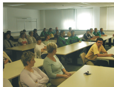
Vodstvo družbe Kostak nas je na Zboru delavcev 2. septembra seznanilo o spremembah v lastniški strukturi, pomembnejših projektih, ki potekajo v družbi, ter načrtih za prihodnost.

Zaplet s Togrelom je delno zameglil ostale dosežke naše družbe. Poslovno leto se sicer konča z decembrom, vendar je celoten postopek zaključen šele ob koncu prve polovice naslednjega leta. Ugotavljanju rezultatov sledi priprava letnega poročila, ki ga nato pregleda in revidira revizijska hiša, zatem ga obravnava nadzorni svet, dokončno pa ga sprejme in po-